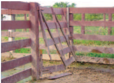
INSTALAÇÕES EM MAU ESTADO DE CONSERVAÇÃO

Alguns dias antes da vacinação, faça uma completa revisão das instalações. Procure manter o piso limpo e seco, com isto os riscos de escorregões e quedas serão menores. O ideal é percorrer o caminho por onde os animais serão conduzidos no curral, verificando se há situações que podem machucá-los (pregos salientes, pedras soltas no chão, buracos, pontas de tábuas e quinas) e que dificultem a sua condução (degraus, poças d'água, lama, sombras e objetos estranhos no caminho). Na medida do possível, esses problemas devem ser corrigidos imediatamente.