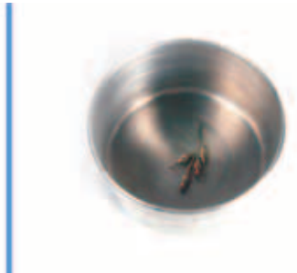
VASILHA PARA FERVER A ÁGUA PARA ESTERILIZAÇÃO DAS AGULHAS