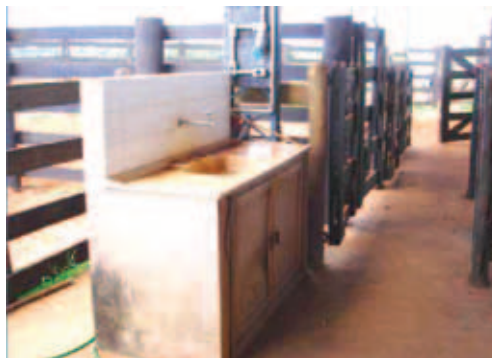
LOCAL DE TRABALHO LIMPO E ORGANIZADO

A água para esterilização deve ser colocada para ferver antes de começar o trabalho e deve ser trocada com frequência, para que esteja sempre limpa.