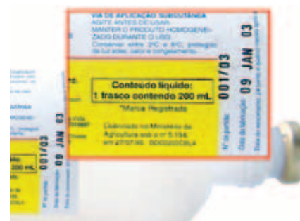
DATA DE VALIDADE E BULA DA VACINA

Dose de reforço: quase todas as vacinas para os bovinos, para expressarem seu efeito máximo, precisam de uma dose de reforço quando o animal a recebe pela primeira vez em sua vida, seguida de doses complementares semestrais ou anuais conforme a orientação do fabricante.