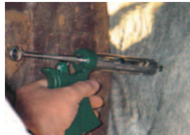
APLICAÇÃO INTRAMUSCULAR CORRETA