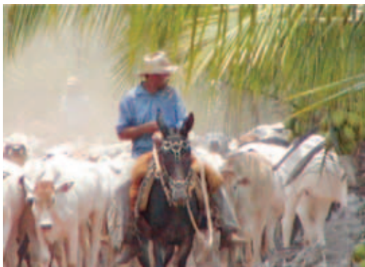
CONDUÇÃO DO GADO COM PONTEIRO

A condução dos animais até o curral deve sempre ser realizada com calma, sem correrias ou gritos, deslocando os animais de preferência ao passo. Use sempre um cavaleiro em frente ao gado “chamando” os animais (ponteiro). Não use ferrão e evite usar o bastão elétrico.