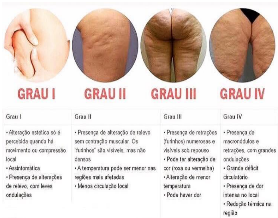
Figura 1: Graus do Fibro Edema Gelóide.

Esta alteração se apresenta na pele por contorno irregular, comum em regiões como abdômen, braços, glúteos e coxas a partir da puberdade (ROSSI, 2000), pode acometer qualquer parte do corpo, exceto as palmas das mãos e dos pés e couro cabeludo.