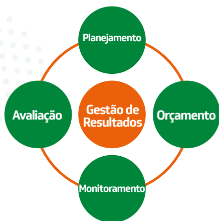
Figura 1 – Ciclo da Gestão Estratégica

O PPA, como mencionado anteriormente, adota a Participação Cidadã como uma premissa para orientação na escolha das políticas públicas do Estado. Assim sendo, o processo participativo está presente na elaboração do plano e deve permanecer durante todo o seu ciclo de gestão. Esse entendimento está alinhado ao conceito de governança pública, que tem por foco não só as entidades públicas isoladamente, mas a articulação e colaboração entre elas e delas com a sociedade civil, possibilitando à administração pública atender às demandas e desafios da sociedade considerando a complexidade dos problemas que se apresentam no mundo moderno.