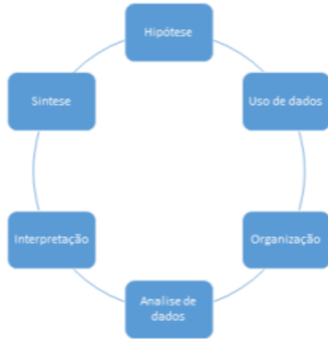
FIGURA 1: Fluxograma das etapas da revisão integrativa