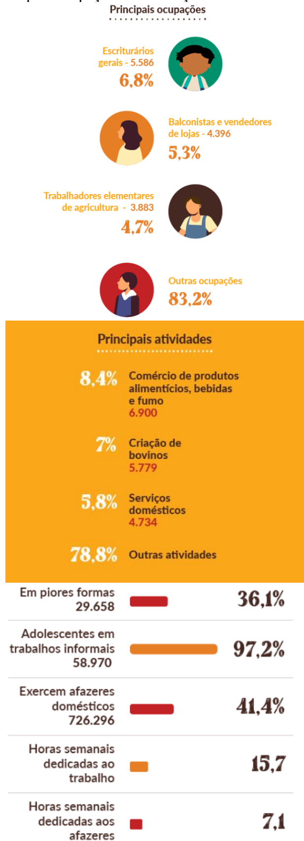
FIGURA 3: Principais ocupações das crianças e adolescentes no Ceará em 2019.