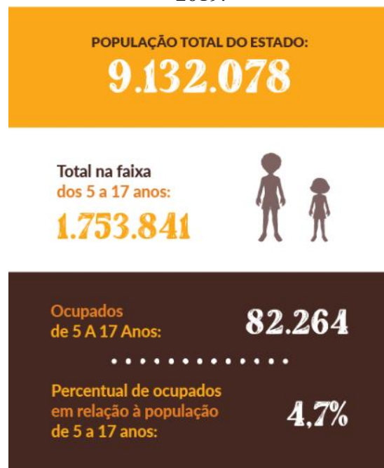
FIGURA 2: Total de crianças e adolescentes de 5 a 17 anos ocupados no estado do Ceará em 2019.