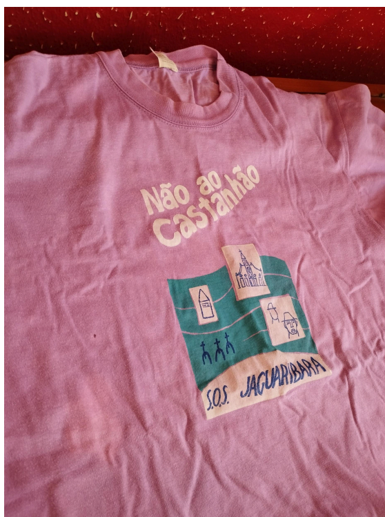
Figura 01: Camisa do Movimento “Não ao Castanhão”