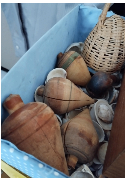
Figura 05: “Pião” que fazia parte das brincadeiras das crianças