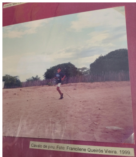
Figura 04: Jovem brincando com “cavalo de Pau”