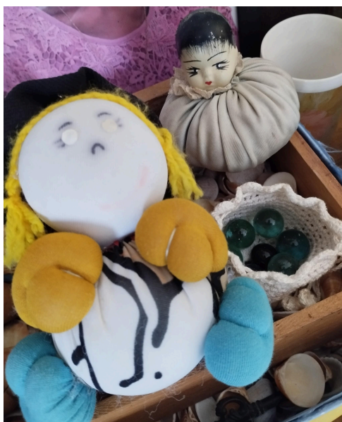
Figura 03: Bonecas