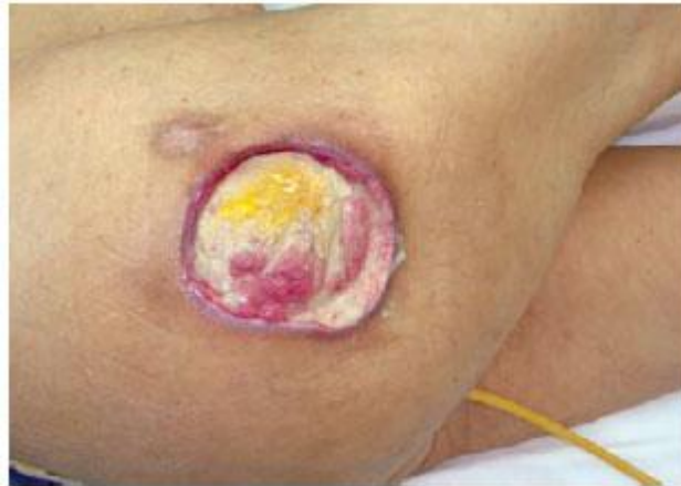
Figura 4 – Lesão Por Pressão