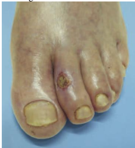
Figura 2 – Úlcera Arterial

As úlceras arteriais surgem de uma perfusão tecidual insuficiente, causada por um bloqueio arterial total ou parcial do fornecimento de sangue. São predominantemente encontradas em zonas de protuberâncias ósseas, como maléolos e falanges, que estão localizadas nos tecidos distais dos membros. As úlceras isquêmicas têm tamanho e profundidade variáveis, profundas que afetam músculos e tendões, envolvidas por uma pele de tom pálido. exibem pequena quantidade de exsudato, ocasionalmente secreção seropurulenta e pequeno inchaço no local. Necrose de tecidos, pele fria e atrofiada, odor fétido, cicatrização difícil e são extremamente sensíveis, conforme a figura abaixo (MORAES, 2021).