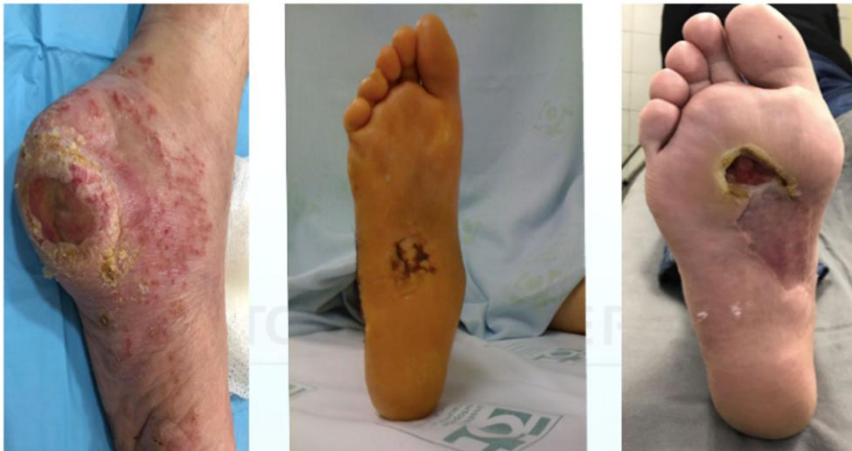
Figura 3 – Úlcera Diabética