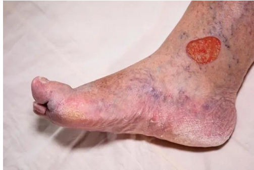
Figura 1: Úlcera Venosa