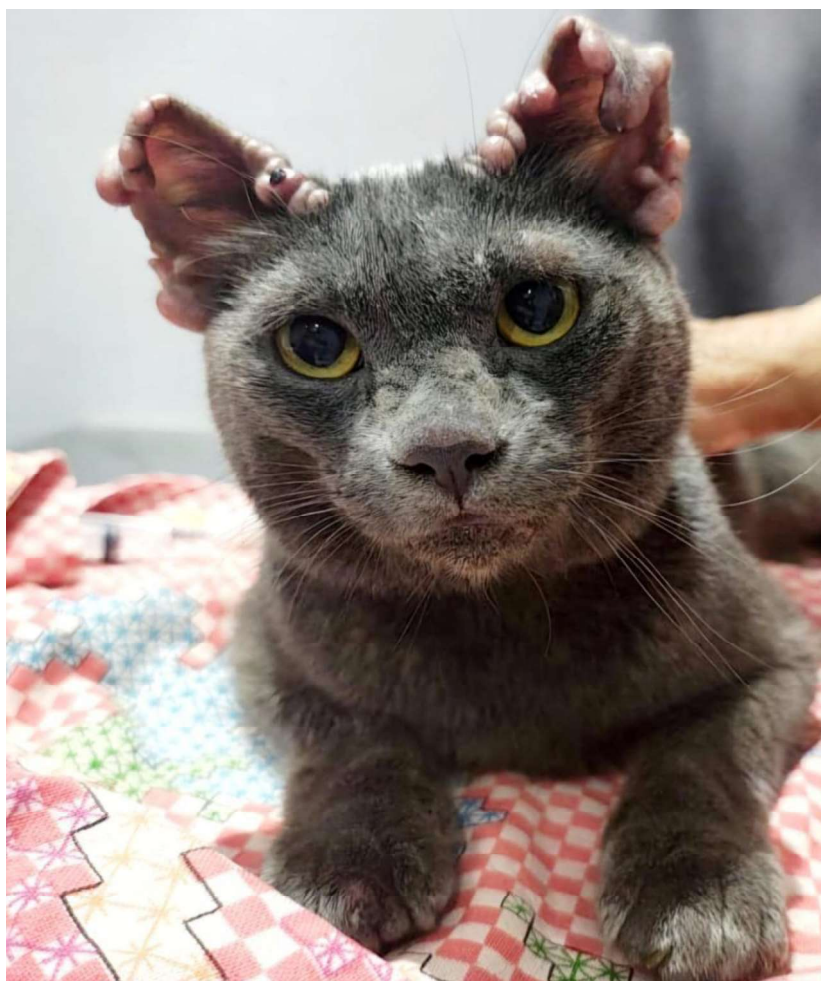
Figura 1: Dermatite nodular granulomatosa em felino com leishmaniose. Observam-se múltiplos nódulos, alopecicos e não ulcerados distribuídos ao longo da borda das orelhas medindo entre 0,5 a 1,2 cm de diâmetro.