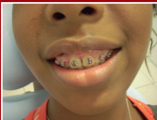
Fotografia 3 – Indicação correta de aparelho ortodôntico