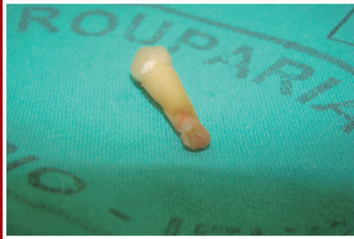
Fotografia 1 – Dente hígido com lesão periodontal

em algumas áreas que sofreram vaso-oclusão. Acrescente-se, ainda, em alguns casos, o fato de a câmara pulpar mostrar calcificações semelhantes a denticulos, podendo ser resultante de trombose nos vasos sanguíneos que irrigam a área afetada. Outra alteração de desenvolvimento, como a hiper cementose, também tem sido observada.